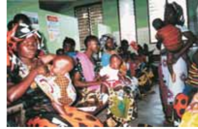
Ob drinnen oder draußen - hier lernen die Bewohner von Nyangao Wichtiges z.B. über Hygiene, Gesundheitsvorsorge und Ernährung.

Nyangao liegt im Süden Tanzanias, weitab von Ballungsräumen und noch weiter ab von gesicherten Verhältnissen.