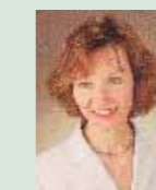
Frau Sch. Vorstandssekretärin