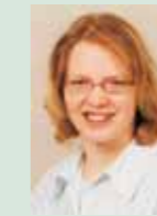
Frau V. Industriekauffrau