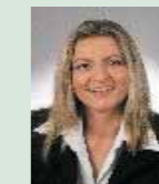
Frau Z. Dipl. Betriebswirtin Buchhalterin