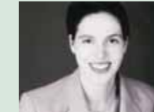
Frau H. Juristin

Hier einige Beispiele von erfolgreichem "Try & Hire" aus dem ersten Quartal 2006: