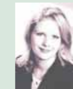
Frau G. Rechtsanwalts- und Notariatsfachangestellte