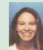
Frau W. MSc International Management for China